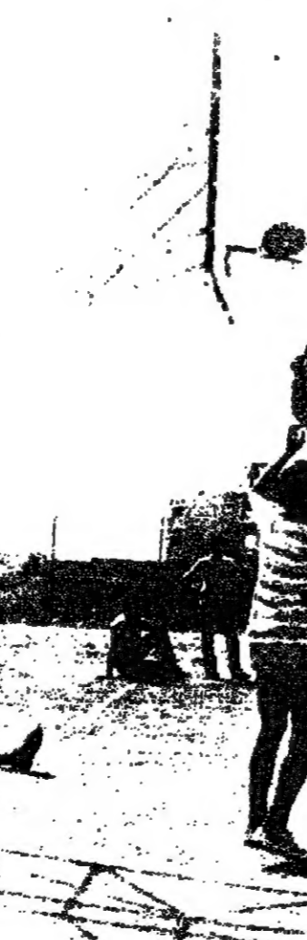
جراة رياضية في كرة السلة بين الطلاب العرب واليهود

المشروع بعد ذاته مفيد للغاية ، خاصة انه عرف بعض العلاقات اليهودية الدينية التي ترمته على طبيعة طلابنا في الراهم ، واللقاءات بين طلاب شعبنا ضرورية ، فاجيل التعمير يتعلم مالا جديدة تختلف كليا عن الماضي ، وهذه الملل قد تمنحس في اجتماعات بين طلاب الشعبين ، وبتعمير عمل على ازالة ما يعاني منه طلابنا العرب من انهم يتعمرون بتسهيلات اقل من زملائهم اليهود .. كما قد يكون فائدة موضوعية في تفوير بعض الاعتبارات التي يعاني منها بعض الطلاب العرب ، خاصة عندما يترقى الطلاب اليهود الى مستوى تفهم المسؤولية التي يتحملونها ، بالإضافة الى كونها تحضر القربة لسلم احترامه كل الطوائف . اما العملية من مدرسة كريات باه فقد كتبت في تقريرها ما يلي :